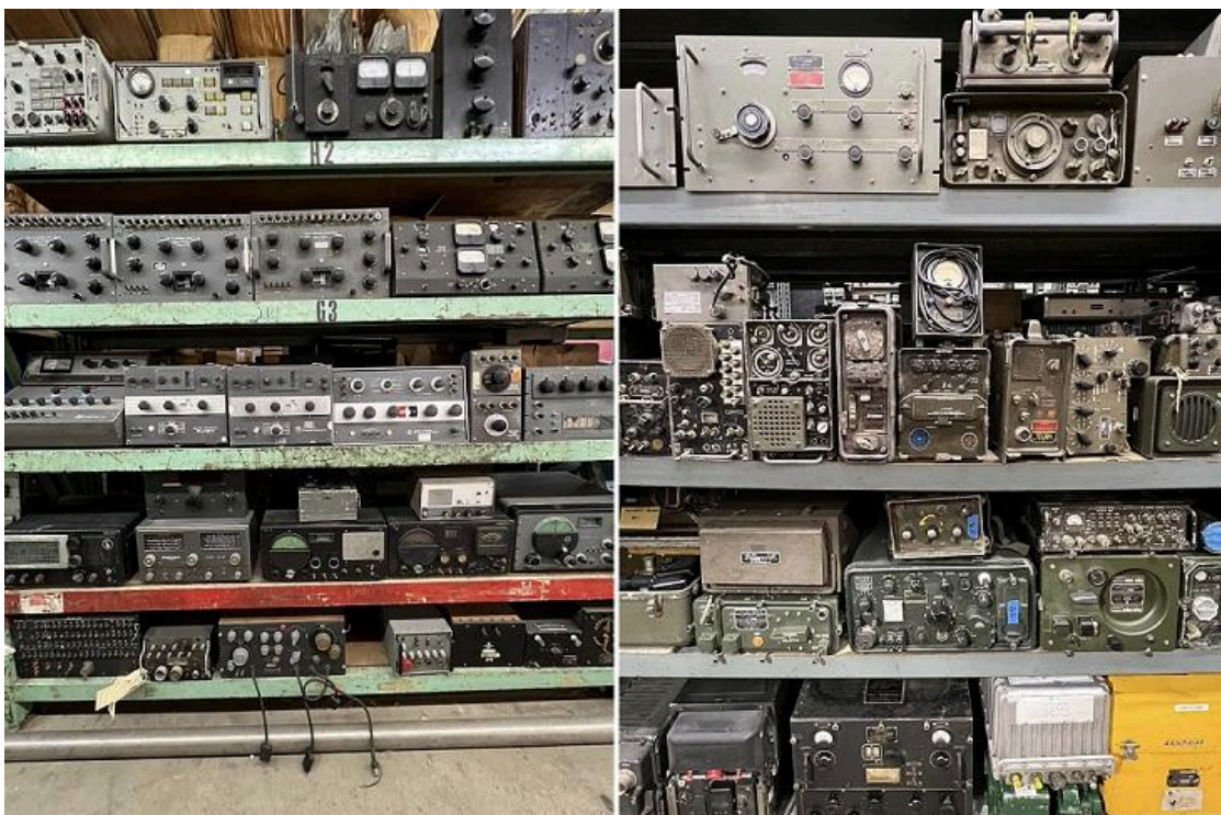
Imagem: Muitos transmissores militares das nacelas da Apex Electronics