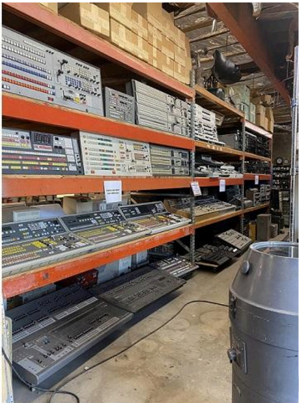
Imagem: Mais equipamentos à venda da Apex Electronics