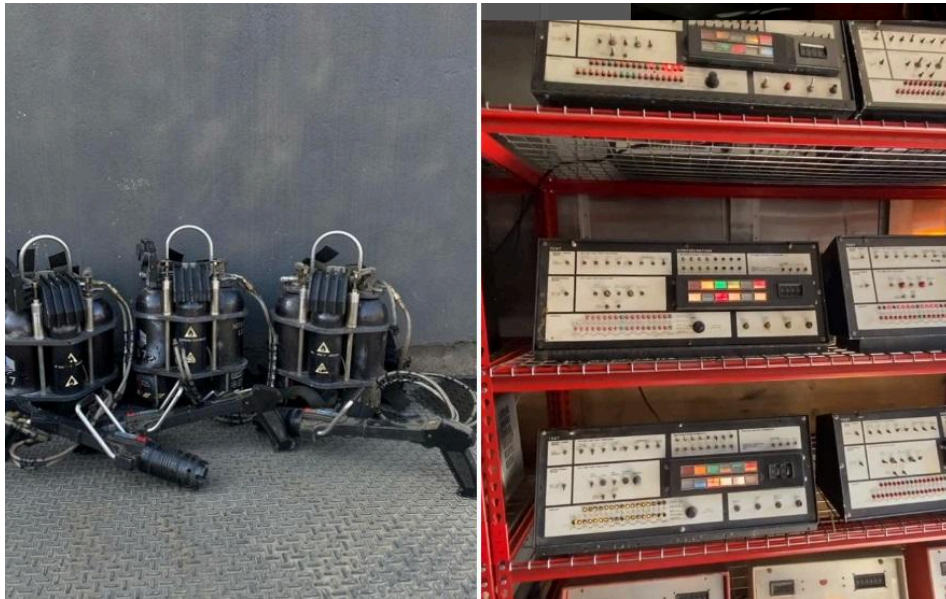
Imagem: Ghostbusters e Apex Electronics

Alguns acessórios foram fornecidos pela Apex Electronics, como alguns painéis de configuração usados no carro Ghostbusters, conhecido como Ecto-1, e as famosas mochilas, que continham “prótons Ghostbusters”.