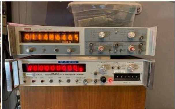
Imagem: Todos os tipos de tecnologia à venda da Apex Electronics