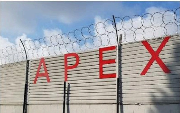
Imagem: Imagens impressionantes do pátio da Apex Electronics