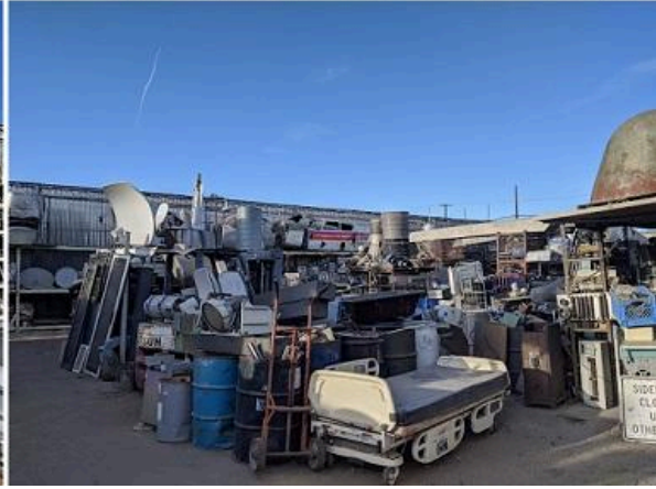
Imagem: Imagens impressionantes do pátio da Apex Electronics