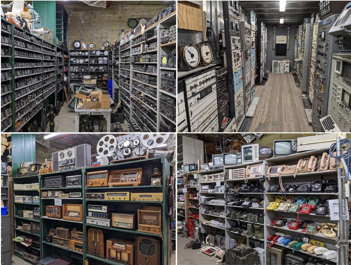
Imagem: Todos os tipos de tecnologia à venda da Apex Electronics