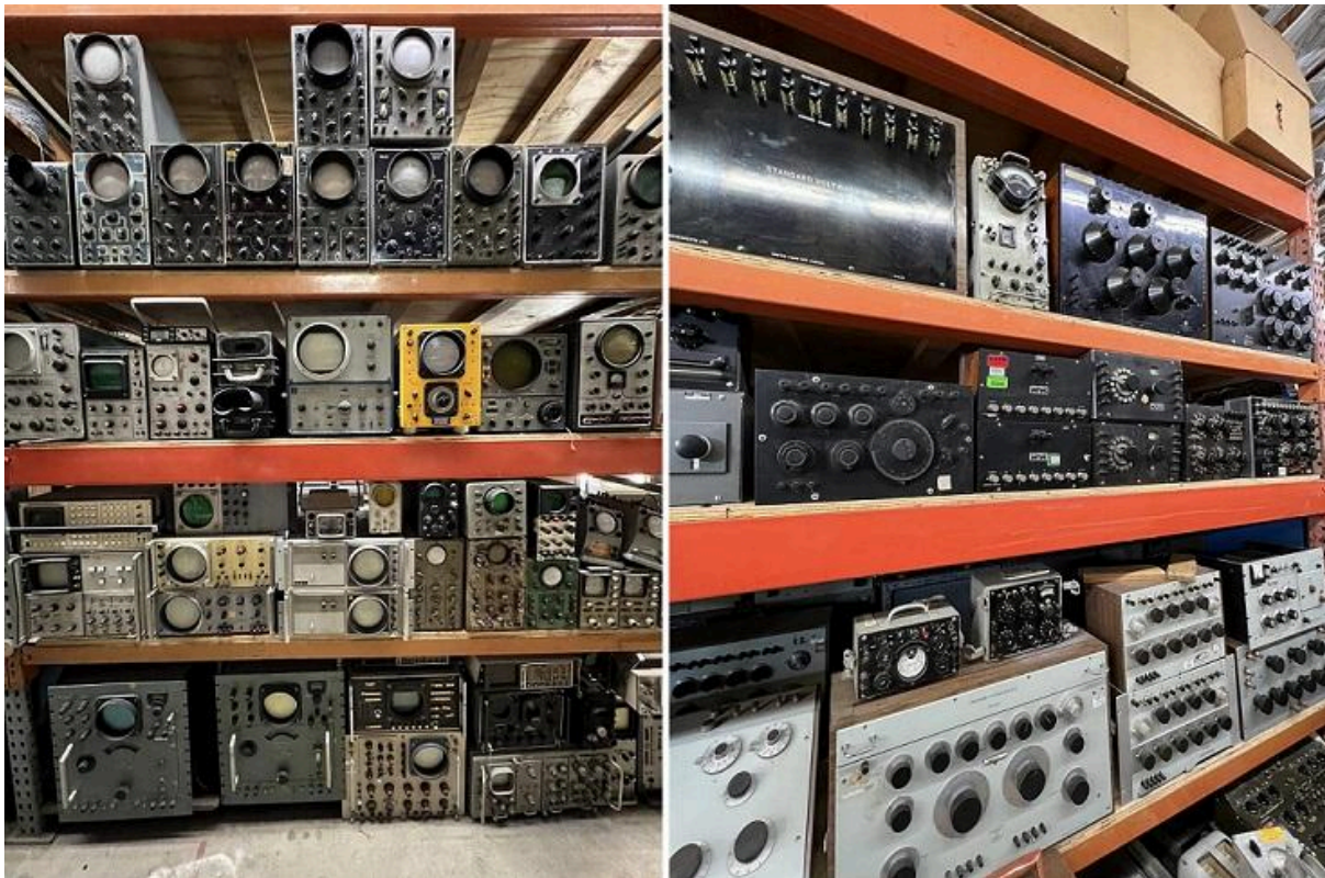
Imagem: Equipamento à venda da Apex Electronics

A lista de filmes e séries onde peças da Apex Electronics foram usadas é interminável: 6 Underground, 13 Reasons Why, 911, 1941, Ad Astra, Agent Shield, Air Force One, Animal Kingdom, Apollo 13, Armageddon, Avatar, Batman Begins, Battleship , A Teoria do Big Bang, Blade Runner, Brooklyn Nine-Nine, Reação em Cadeia, Danos Colaterais, Mentas Criminosas, Maré Carmesim, CSI, O Cavaleiro das Trevas, Deppimpact, Dejavu, Demolition Man, Borracha, Decisão Executiva, Extraordinário, Velozes e Furiosos , Para todos os Manking, Ford e Ferrari, Frankenstein, Jurassic Park, Lost, Matrix, Mag Gyver, Robocop, Twister, etc.