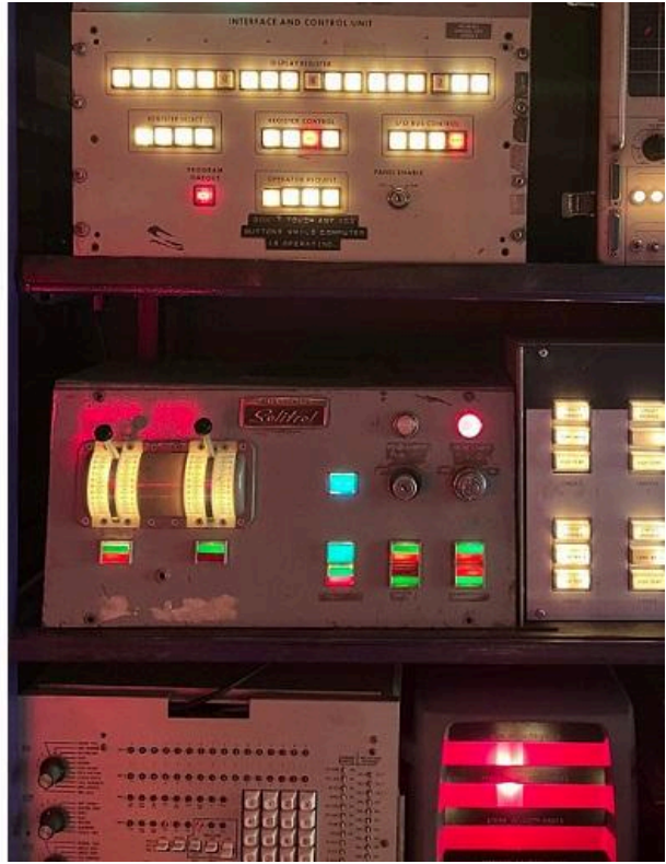
Imagem: Mais equipamentos à venda da Apex Electronics