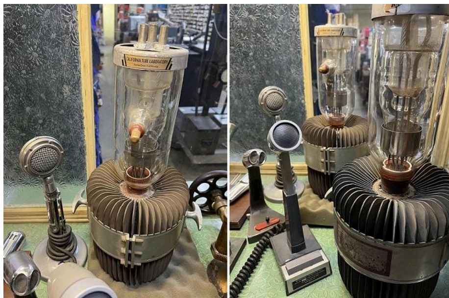
Imagem: Algumas lindas válvulas Apex Electronics