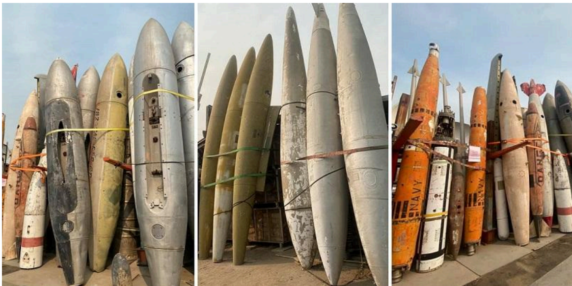
Imagem: Imagens impressionantes de mísseis à venda no estaleiro Apex Electronics