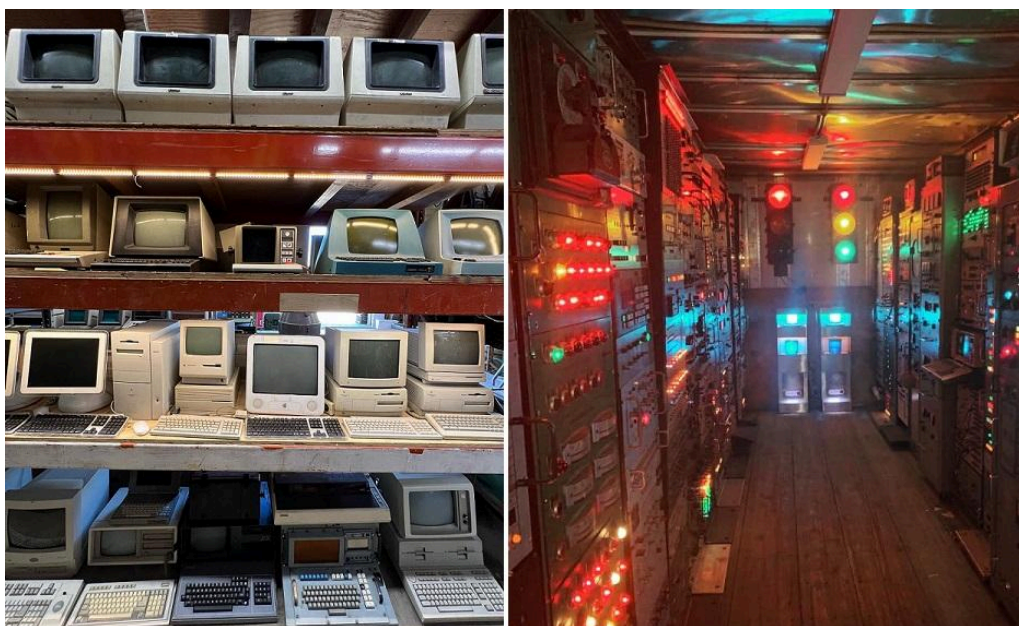
Imagem: Computadores e equipamentos antigos à venda da Apex Electronics

Enquanto isso, aproveite as imagens que preparei especialmente para você.