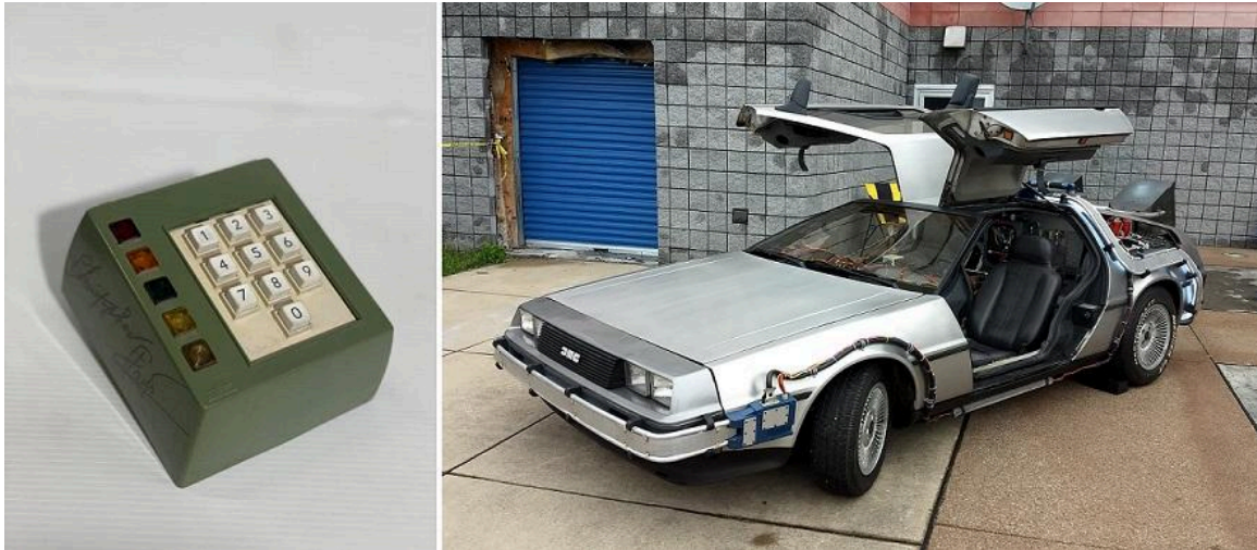
Imagem: De volta para o futuro e Apex Electronics

A lista de filmes e séries onde peças da Apex Electronics foram usadas é interminável: 6 Underground, 13 Reasons Why, 911, 1941, Ad Astra, Agent Shield, Air Force One, Animal Kingdom, Apollo 13, Armageddon, Avatar, Batman Begins, Battleship , A Teoria do Big Bang, Blade Runner, Brooklyn Nine-Nine, Reação em Cadeia, Danos Colaterais, Mentas Criminosas, Maré Carmesim, CSI, O Cavaleiro das Trevas, Deppimpact, Dejavu, Demolition Man, Borracha, Decisão Executiva, Extraordinário, Velozes e Furiosos , Para todos os Manking, Ford e Ferrari, Frankenstein, Jurassic Park, Lost, Matrix, Mag Gyver, Robocop, Twister, etc.