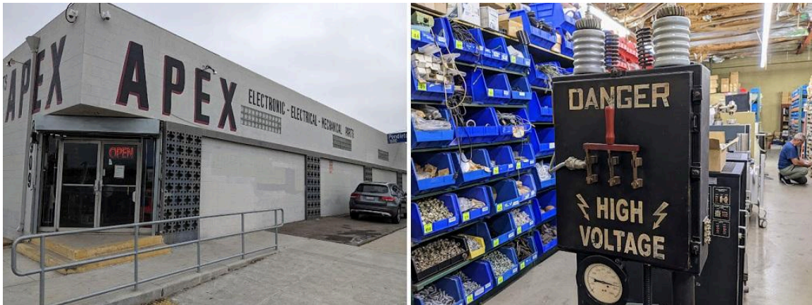
Imagem: Loja Apex Electronics