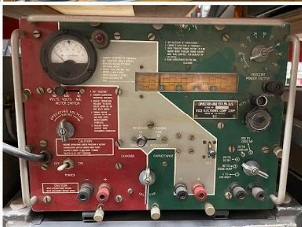
Imagem: Todos os tipos de tecnologia à venda da Apex Electronics